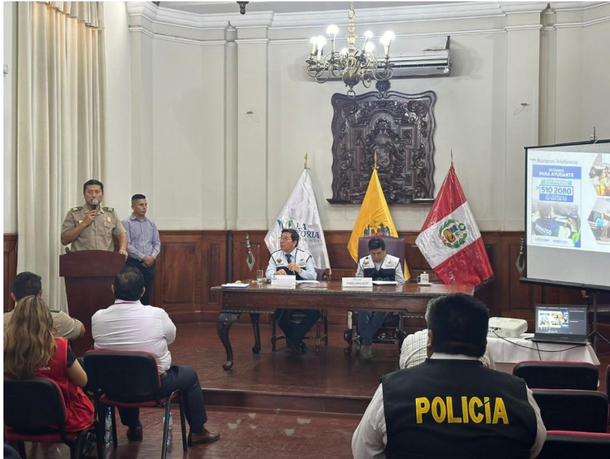
Fotografía 2: "4ta. Consulta Pública del 2024 del CODISEC LA VICTORIA"